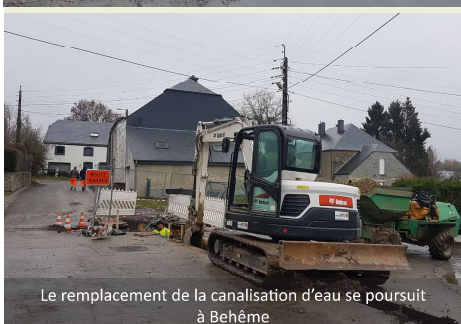
Le remplacement de la canalisation d'eau se poursuit à Behême