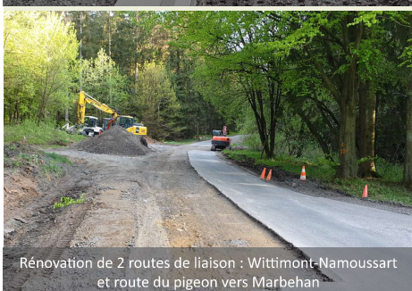
Rénovation de 2 routes de liaison : Wittimont-Namoussart et route du pigeon vers Marbehan