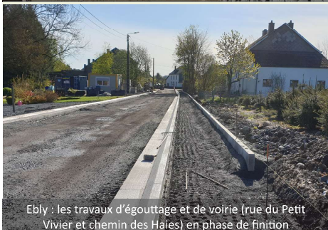
Ebly : les travaux d'égouttage et de voirie (rue du Petit Vivier et chemin des Haies) en phase de finition