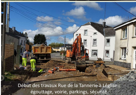
Début des travaux Rue de la Tannerie à Léglise : égouttage, voirie, parkings, sécurité