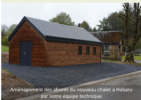
Aménagement des abords du nouveau chalet à Habaru par notre équipe technique