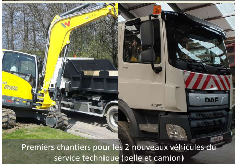
Premiers chantiers pour les 2 nouveaux véhicules du service technique (pelle et camion)