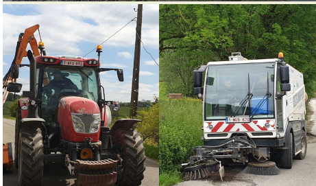
Bienvenue à nos 2 nouveaux chauffeurs Gaby et Philippe, occupés aux travaux d'entretien de nos routes