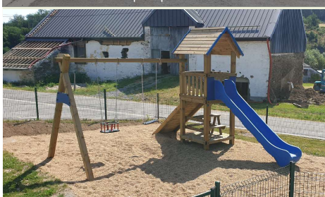
Plaine de jeux à Volaville : résultat d'une collaboration entre la firme TVB et notre équipe technique