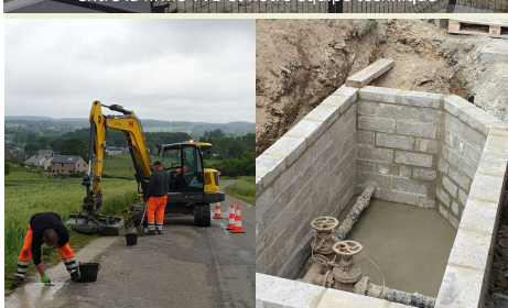
Renforcement de l'accotement à Légglise et création d'une chambre à Chêne pour améliorer la distribution d'eau