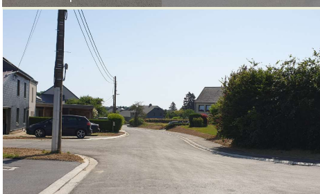
Ebly : les travaux des rues du Petit Vivier et Chemin des Haies sont pratiquement terminés