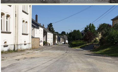
Dans le cadre du bail d'entretien voirie 2019, rénovation de la rue des Forges à Mellier