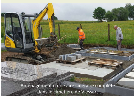
Aménagement d'une aire cinéraire complète dans le cimetière de Vlessart