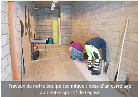
Travaux de notre équipe technique : pose d'un carrelage au Centre Sportif de Légglise