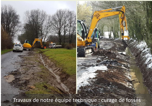
Travaux de notre équipe technique : curage de fossés