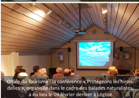
Office du Tourisme : la conférence « Protégeons les hirondelles », organisée dans le cadre des balades naturalistes, a eu lieu le 09 février dernier à Légglise