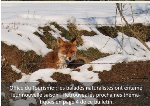
Office du Tourisme : les balades naturalistes ont entamé leur nouvelle saison ! Retrouvez les prochaines thématiques en page 4 de ce bulletin.