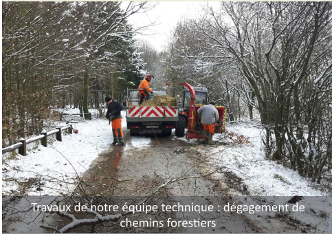
Travaux de notre équipe technique : dégagement de chemins forestiers