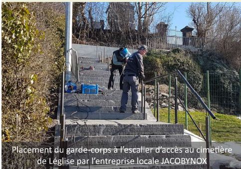
Placement du garde-corps à l'escalier d'accès au cimetière de Légglise par l'entreprise locale JACOBYNOX