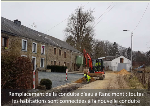
Remplacement de la conduite d'eau à Rancimont : toutes les habitations sont connectées à la nouvelle conduite