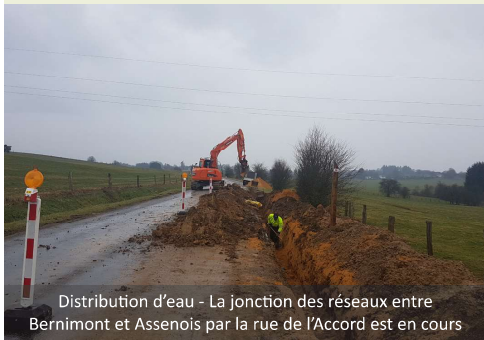
Distribution d'eau - La jonction des réseaux entre Bernimont et Assenois par la rue de l'Accord est en cours