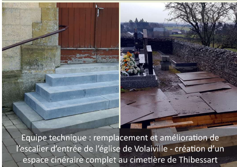
Équipe technique : remplacement et amélioration de l'escalier d'entrée de l'église de Volaiville - création d'un espace cinéraire complet au cimetière de Thibessart