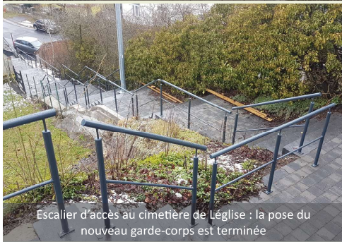
Escalier d'accès au cimetière de Légglise : la pose du nouveau garde-corps est terminée