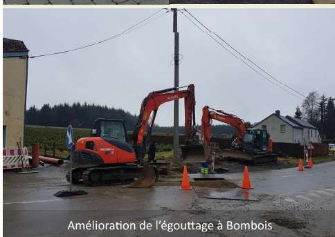
Amélioration de l'égouttage à Bombois