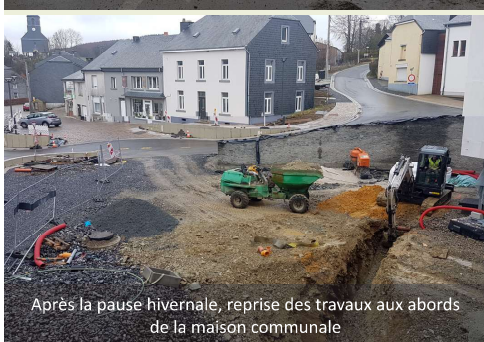
Après la pause hivernale, reprise des travaux aux abords de la maison communale